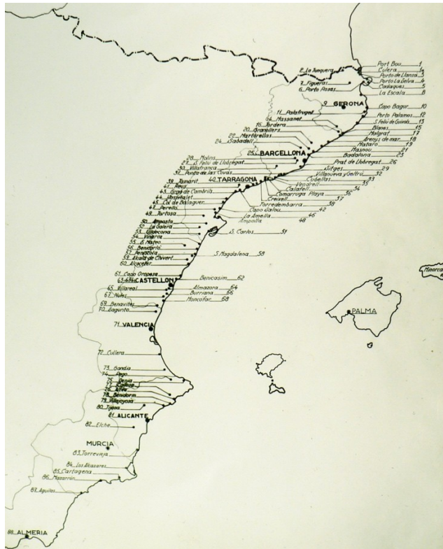
Llistat d'objectius militars de l'Aviazione Legionaria Italiana.