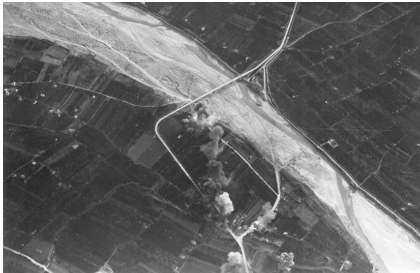
Bombardeig als ponts del Millars, 13/12/1938.