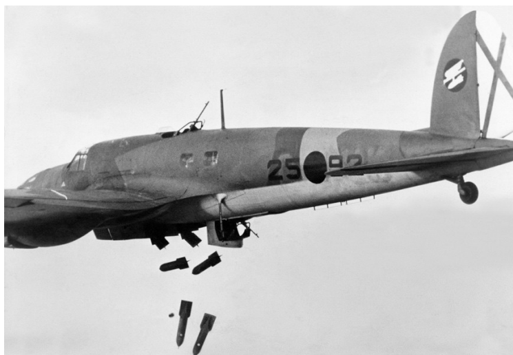
Heinkel He-111 de la Legió Cóndor.