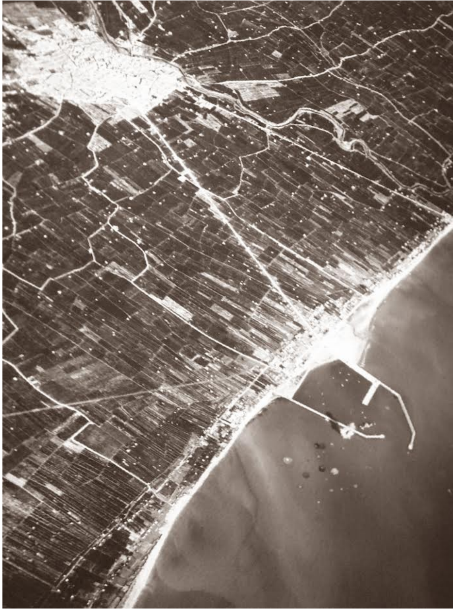
Bombardeig al port de Borriana, 16/01/1938. Ufficio Storico dello SME, Roma