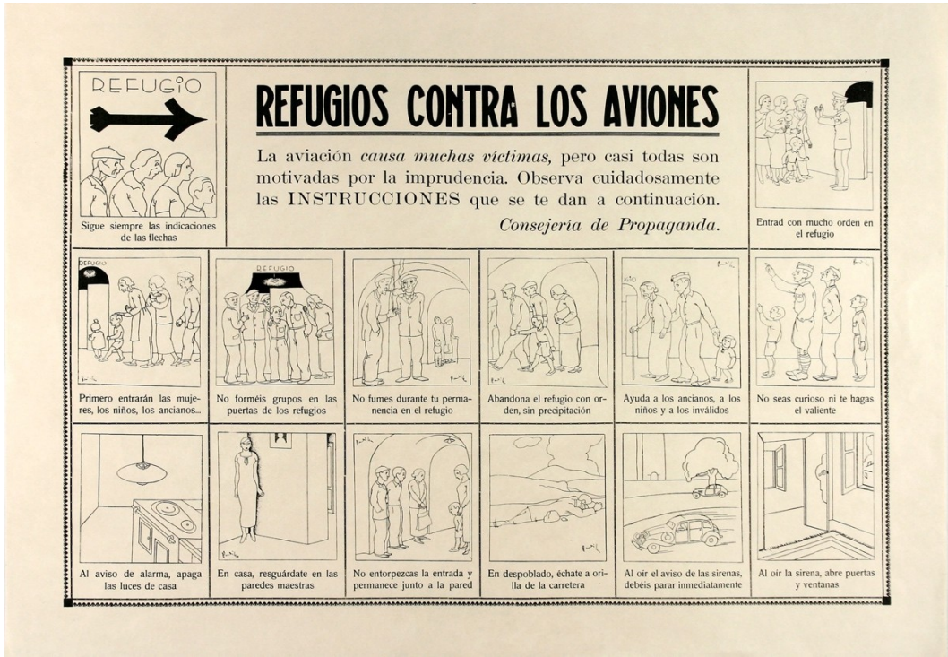
Instruccions per a casos d'alarma. Conselleria de Propaganda, 1937