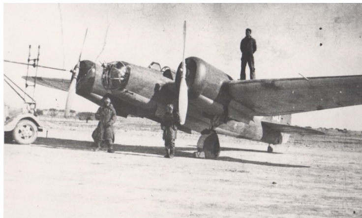
Tupolev SB-2 Katiuska