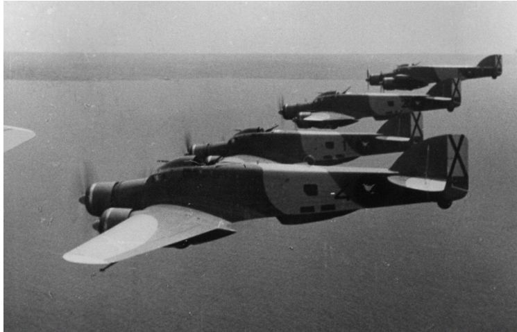
Bombarders Savoia SM-79